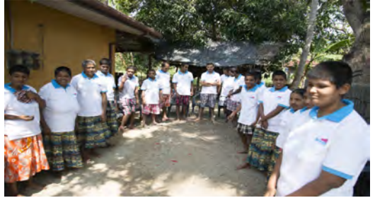
Op bezoek bij geestelijk gehandicapte tehuis. Donatie van T-shirts

Ook hebben we in Sigiriya nog wat kleine bezoekjes gebracht. Zo hebben wij het ziekenhuis bezocht en een kleine donatie gedaan van bloeddrukmeters. Ook zijn we langs het bejaardentehuis geweest, want daar waren rollators en klamboes aan gedoneerd, alleen de oudjes waren er niet... hmm.. Op pad?