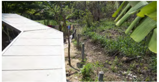
Het tehuis wil graag een gemetselde muur om hun terrein