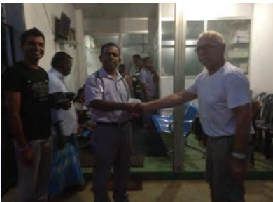
Laat in de avond nog voor donatie langs ziekenhuis Sigiriya geweest