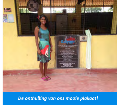
De onthulling van ons mooie plakaat!

De voorzitter moest meteen doorlopen om als eerst het indrukwekkende plakaat te onthullen dat achter een gordijntje verstopt zat. Erg spannend! Het plakaat was prachtig, met Kalyani logo er op en alle namen die hebben geholpen. Daarnaast hing ook het bordje van onze grootste sponsor Kiwanis. Vervolgens moest ze snel doorlopen om symbolisch het lint door te knippen ter ere van de nieuwe opening van de school. Pff... nou alles was goed gegaan, gelukkig maar want er werden zoveel foto's gemaakt.